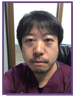
水谷 到 先生 森動物病院